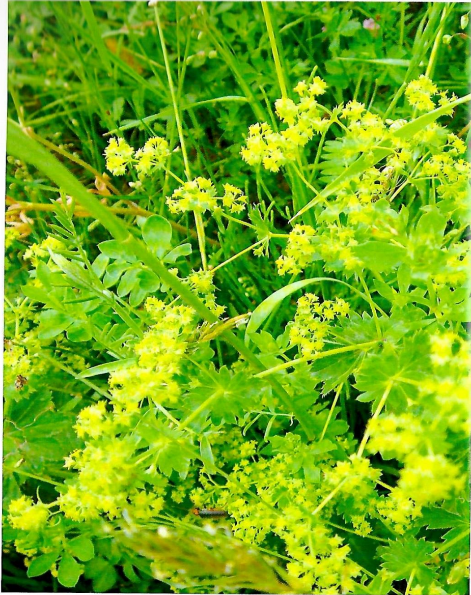
Liebevolle mütterliche Energie umhüllt dich, du kannst getrost dem Neuen begegnen