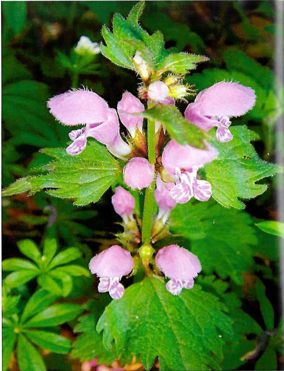
Werde stark in der Beziehung zur dir selbst und den Mitmenschen