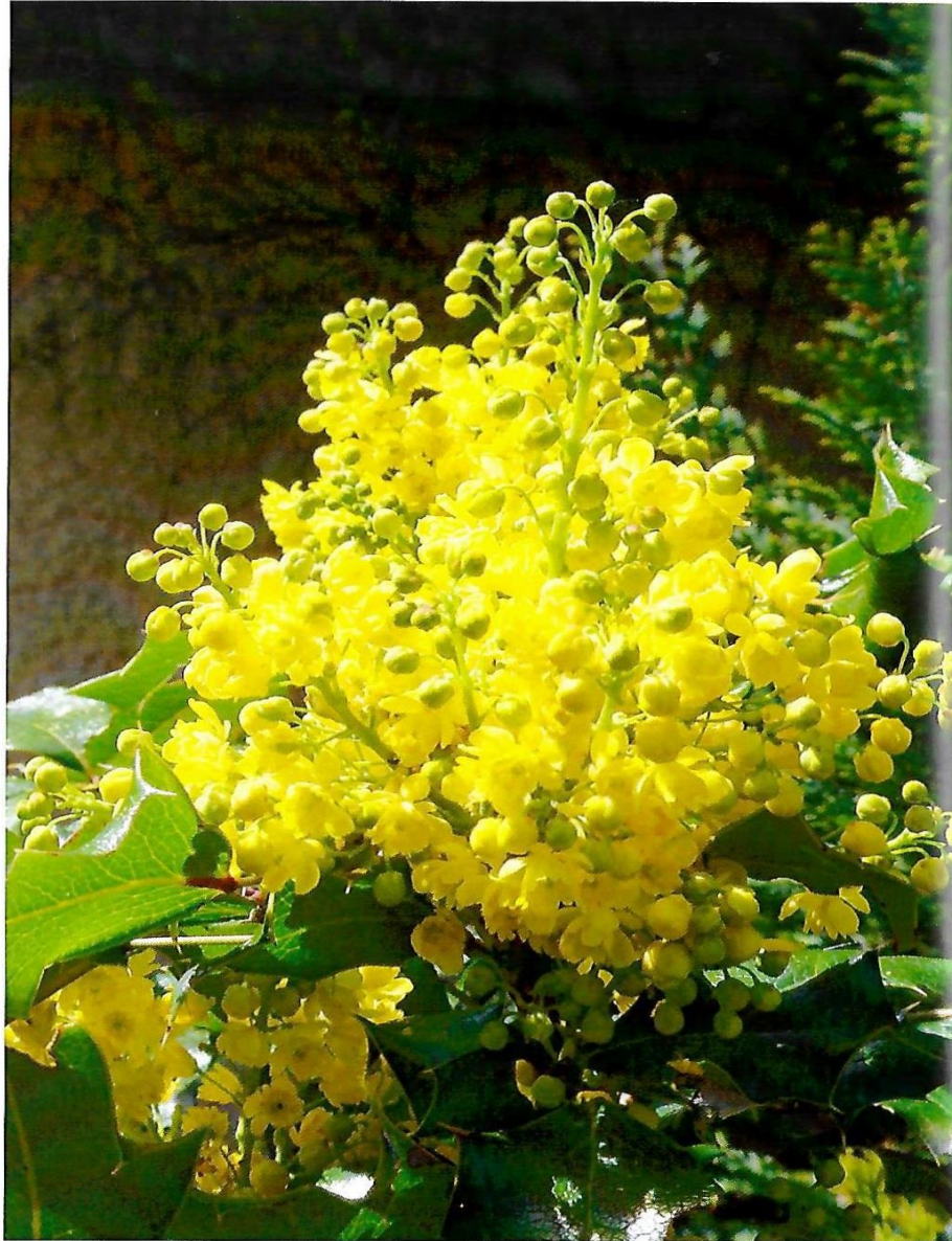
Friede und Urvertrauen durchströmen dich